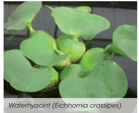
Waterhyacint ( Eichhornia crassipes )