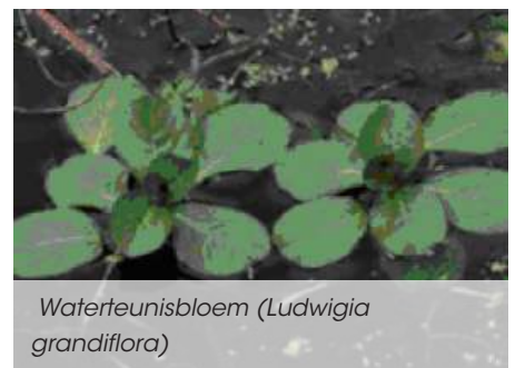
Waterteunisbloem ( Ludwigia grandiflora )