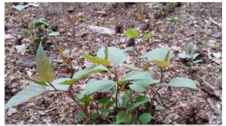
Japanse duizendknoop ( Fallopia japonica )