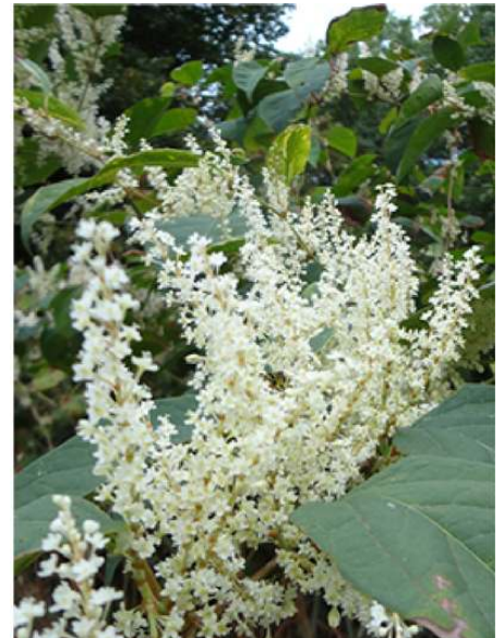
Japanse duizendknoop ( Fallopia japonica )

Bijgevoegd foto's van betreffende planten, zodat je ze kunt herkennen.