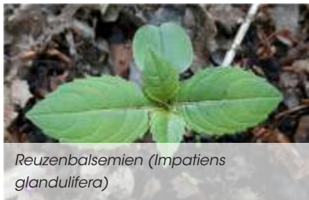
Reuzenbalsemien ( Impatiens glandulifera )