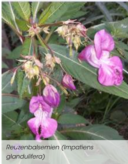
Reuzenbalsemien ( Impatiens glandulifera )