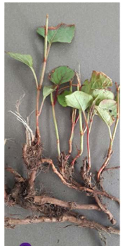
Japanse duizendknoop ( Fallopia japonica )