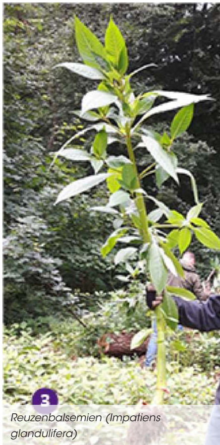
Reuzenbalsemien ( Impatiens glandulifera )