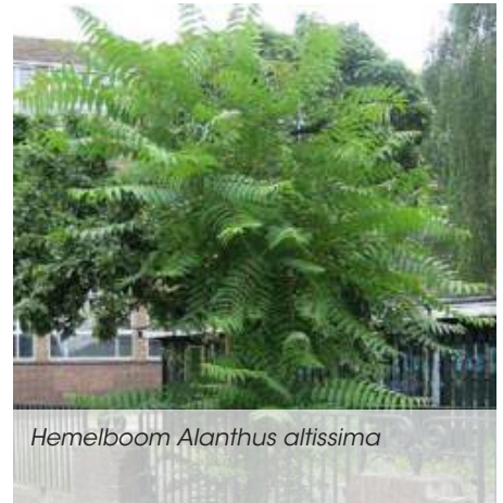
Hemelboom Ailanthus altissima