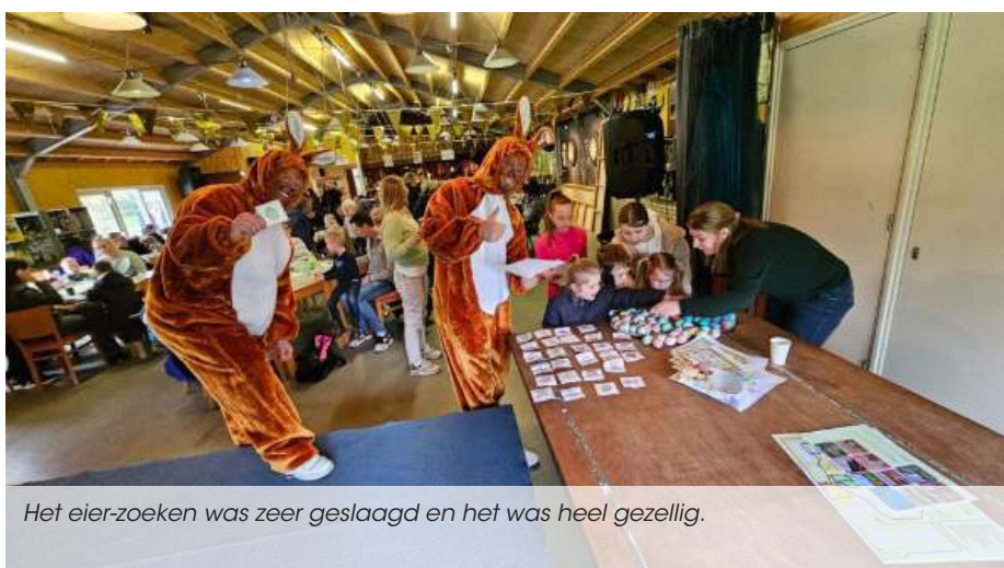
Het eier-zoeken was zeer geslaagd en het was heel gezellig.