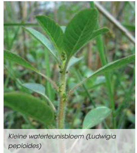
Kleine waterteunisbloem ( Ludwigia peploides )