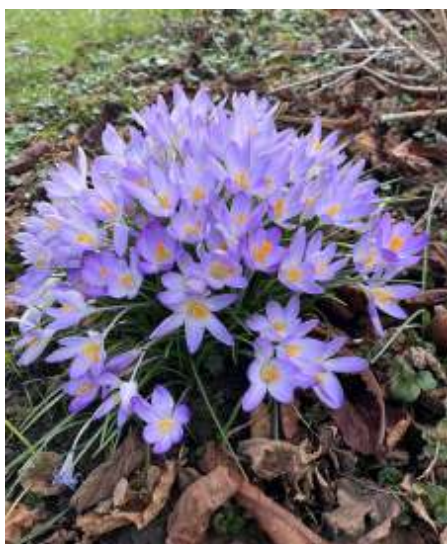
De lente meldt zich