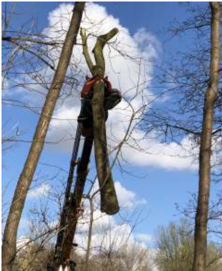
Er is groot materieel nodig