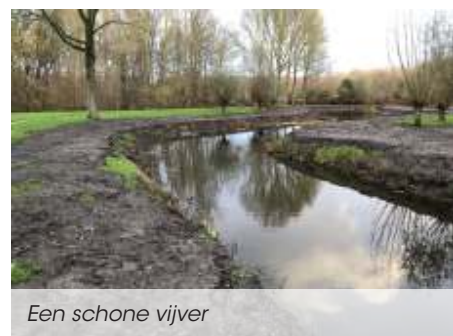
Een schone vijver