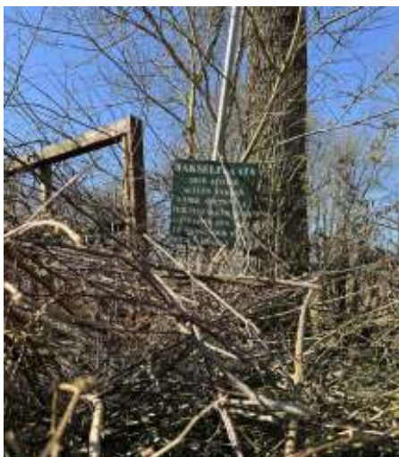
Hoera! De hakselplaats wordt goed gevonden