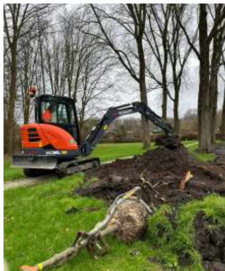
Planten van nieuwe bomen