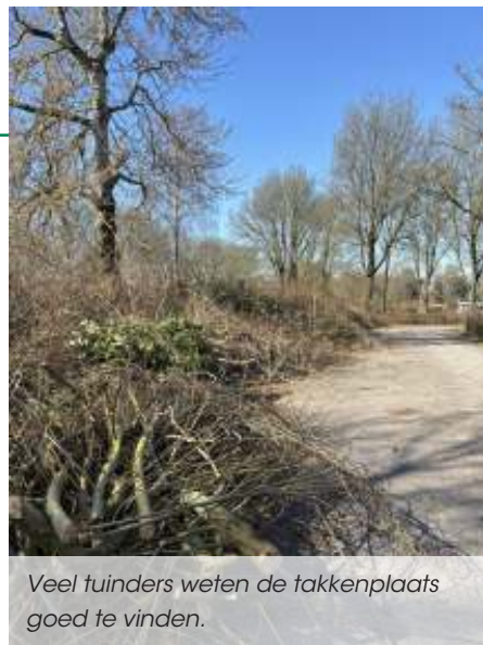
Veel tuinders weten de takkenplaats goed te vinden.

Je artikel voor in de volgende Water-Lander graag vóór 15 mei 2025 mailen naar communicatie@vtv-waterland.nl .