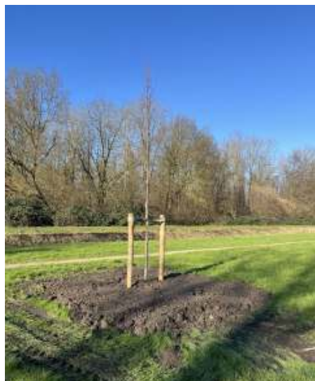
Een nieuwe boom!