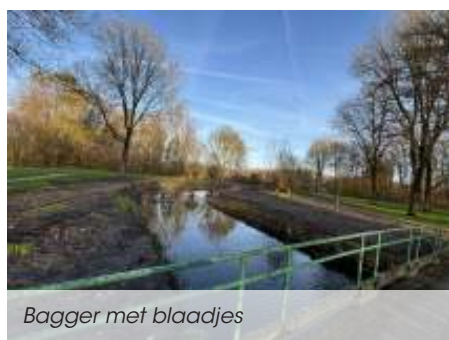
Bagger met blaadjes