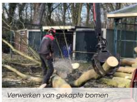
Verwerken van gekapte bomen

Al met al was het een veel grotere en dus duurdere klus dan voorzien, maar nu zijn we klaar voor de komende acht of tien jaar.