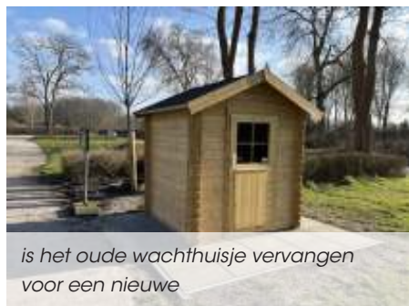
is het oude wachthuisje vervangen voor een nieuwe