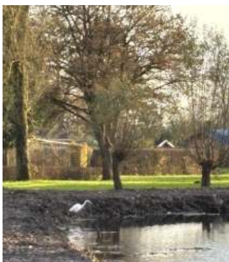
Zilverreiger en blauwe reiger langs de vijver