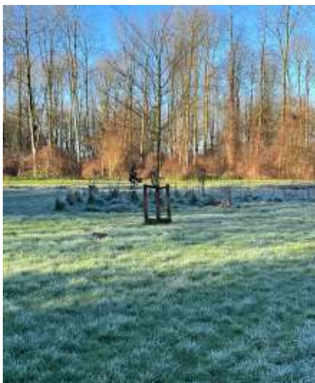
Water-Land na een nachtvorst