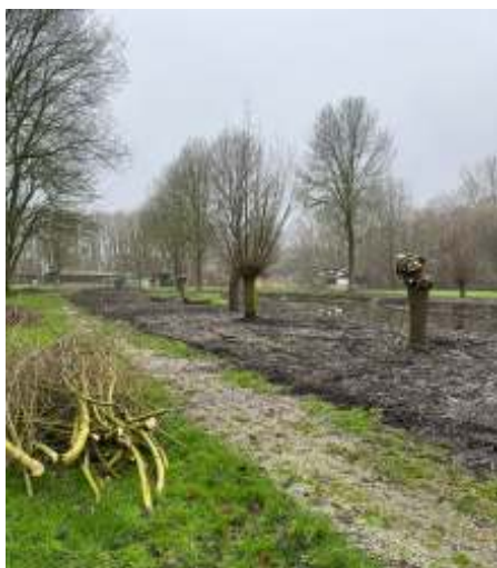
Wilgen weer geknot door de vrijwilligers van Staatsbosbeheer.