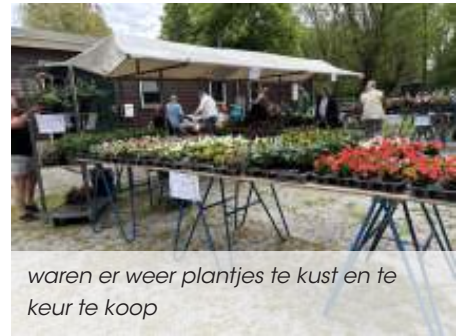
waren er weer plantjes te kust en te keur te koop