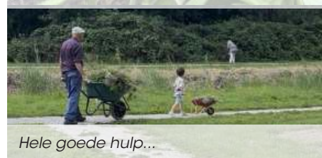
Hele goede hulp...