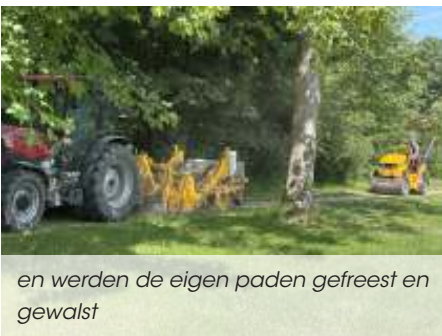
en werden de eigen paden gefreest en gewalst