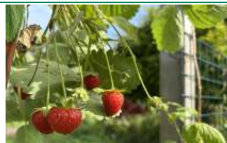
Mignon: de eerste aardbeien zijn rijp!