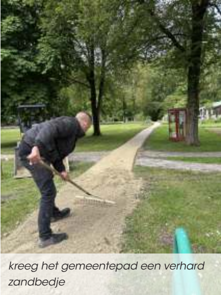
kreeg het gemeentepad een verhard zandbedje