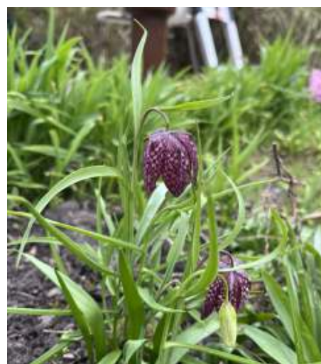
Gijsje: In mijn nieuwe tuin komt een kievisbloem op! Nooit eerder gezien.