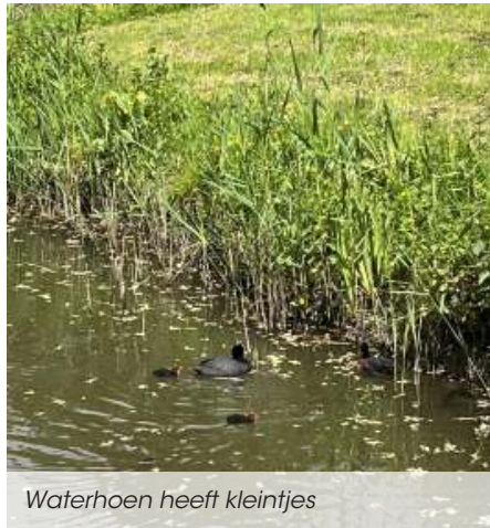
Waterhoen heeft kleintjes