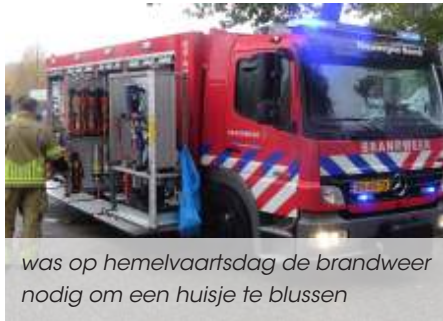
was op hemelvaartsdag de brandweer nodig om een huisje te blussen