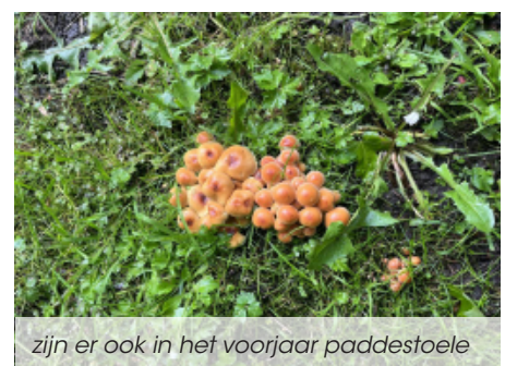
zijn er ook in het voorjaar paddestoele