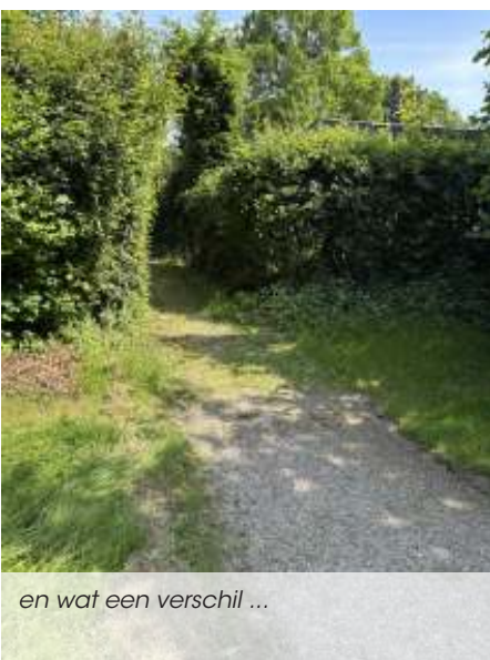
en wat een verschil ...