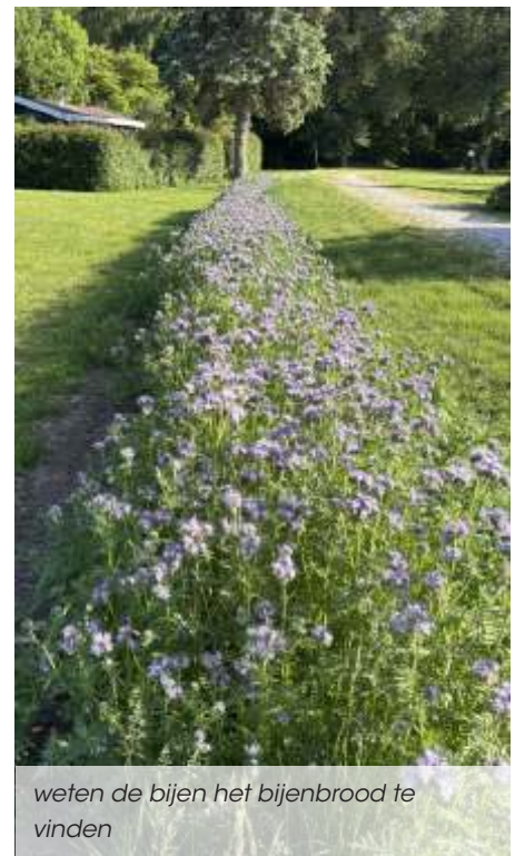
weten de bijen het bijenbrood te vinden